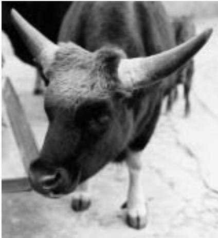
De enorme hoorns van het Watusi-rund (Afrika)

gen om uit zeer ruw voedsel (krantenpapier) melk te produceren. In wezen geeft het rund, en zeker de oudere dieren, zich volledig over aan de inwendige stofwisseling. Bij de aanblik van het dier lijkt het of je via de ogen naar binnen kunt kijken.