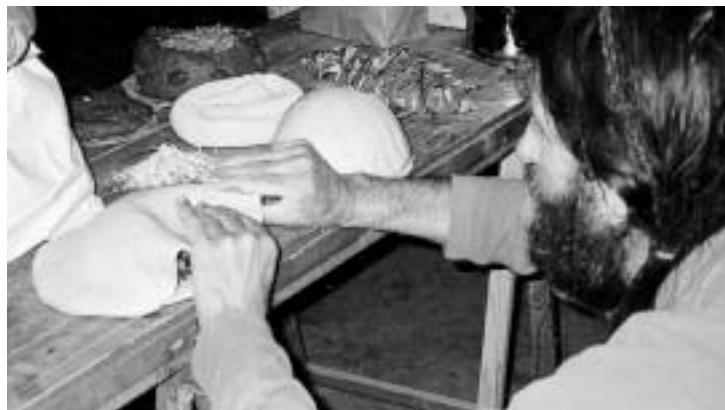
Het maken van paardebloempreparaat o.a. in kleivorm, november 2001 op Ter Linde.

Naast deze regionale initiatieven is de afgelopen winter ook de werkgroep 'Preparaten en