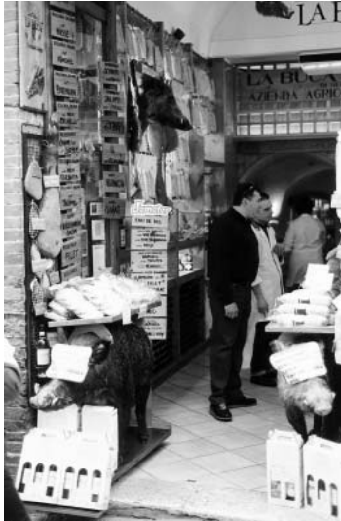
Demeter is een internationaal keurmerk met 'Demeter-lidstaten'. Hier Demeter in Toscane (Italië).

Enerzijds ziet Nederland het belang hiervan heus wel in, zeker als exporteerend land. Je dient waar voor hun geld te geven. Demeter in Nederland dient dezelfde zeggingskracht te hebben als Demeter in Duitsland. Anderzijds moet er ook gekeken worden wat Nederland kan waarmaken en wat passend is ten opzichte van andere landen. Ook in veel andere landen, ook buiten Europa dient nog veel 'bijgespijkerd' te worden om te voldoen aan de normen volgens Demeter Internationaal. Nederland staat wat dit betreft wel in het brandpunt van de belangstelling, omdat Nederland sterk exporteert en zich in de wereld sterk presenteert met z'n producten. Dan is het logisch dat er vanuit Demeter Internationaal eerst gekeken wordt naar Nederland. Ook in de handel zijn nieuwe normen vastgesteld. Op dat gebied heeft Duitsland bijvoorbeeld op voorhand gesteld dat er in producten geen carrageen mag voorkomen. Als dat niet per 1 januari 2002 door Nederland gegaran-