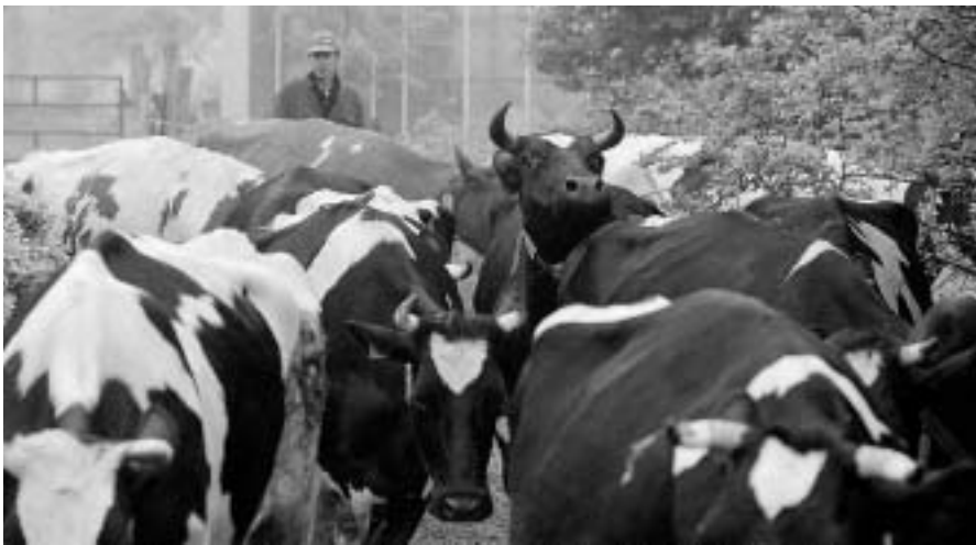
Koeien halen op De Hondspol in Driebergen.