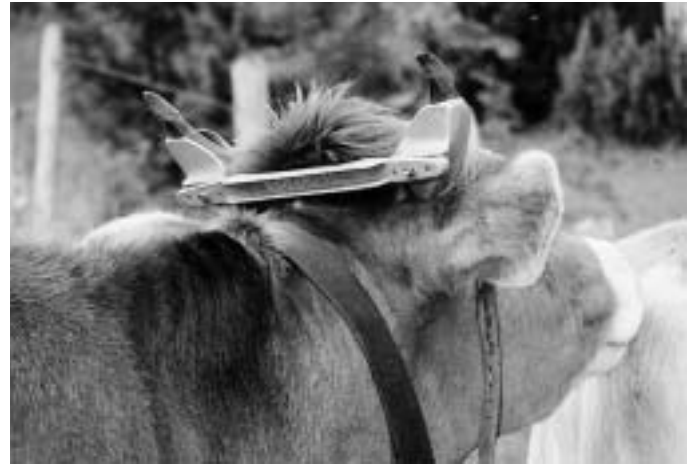
Hoornklemmen ter correctie van de hoornstand

Doordat landbouwhuisdieren de ruimte die zij natuurlijkerwijze ter beschikking hebben, wordt ontnomen, ontstaan er problemen. Problemen zoals pikken bij pluimvee en staartbijten bij varkens zijn symptomen van verveling en gebrek aan activiteiten. In de gangbare landbouw worden deze problemen opgelost door de fysieke veroorzakers weg te nemen. Kortom snavels worden ingekort, staarten gecoupeerd en tanden geknipt. Zodra de dieren meer ruimte en afleiding krijgen, zijn deze ingrepen niet meer noodzakelijk. Bij onthoornen ligt het probleem wat genuanceerder. Om schade (stoten) te beperken, hebben de runderen meer leefruimte nodig dan ligboxenstallen bieden. Daarnaast moeten dieren voldoende ruimte hebben om uit te kunnen wijken. De uitgave van het Louis Bolk Instituut "Een koppel koeien is nog geen kudde" (Ton Baars en Liesbeth Brands 2000) geeft