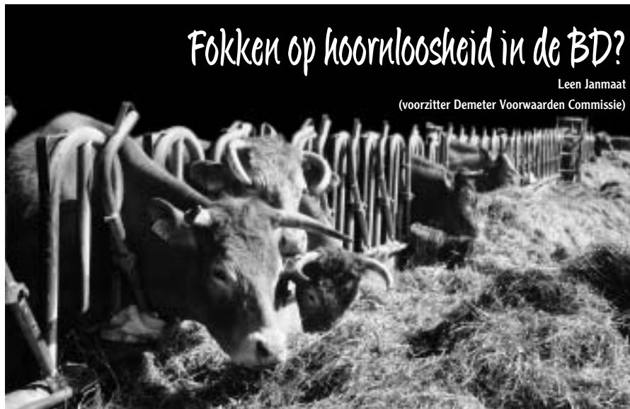
Onthoornen is in de BD niet toegestaan.

Een volledige versie van deze bijeenkomst is in de maak en kan besteld worden. Zie voor haar adres en ook haar MKZ verhaal: www.marie-kedevrij.org .