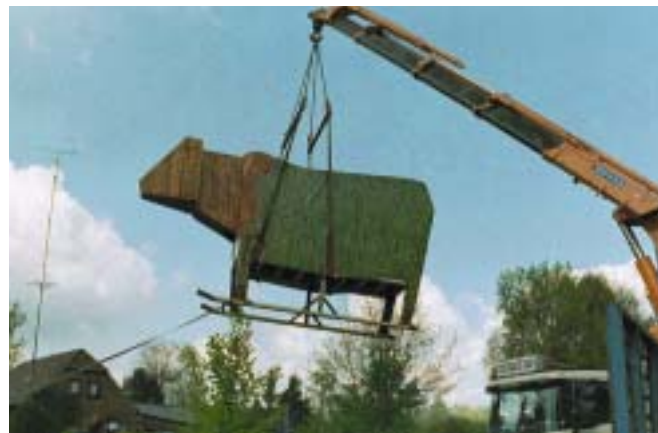
De Koe van Troje op De Kleine Aarde Boxtel

Stichting Avalon werkt aan nieuwe vormen van grondgebruik en