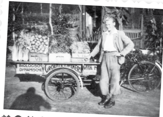
De afzet van groente van Vita Nova ging per bakfiets, Den Haag 1940