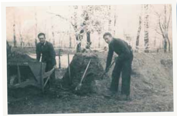
Vita Nova 1938: Zodencompost

derij aan den Zijdeweg te Wassenaar, waarin deze methode wordt toegepast. Wat is eigenlijk de biologisch-dynamische methode, waarop dr Rudolf Steiner in Europa het eerst de aandacht heeft gevestigd, voortbouwend op gedachten van Goethe? Zij gaat uit van de gedachte, dat de grond is een levend organisme en dat zijn leven moet worden in stand gehouden, opdat hij gezond voedsel voor den mensch kan opleveren. De methode begint dus met den grond, ons aller voeder. Zij tracht dien gezond te houden door zijn levenskracht te versterken.'