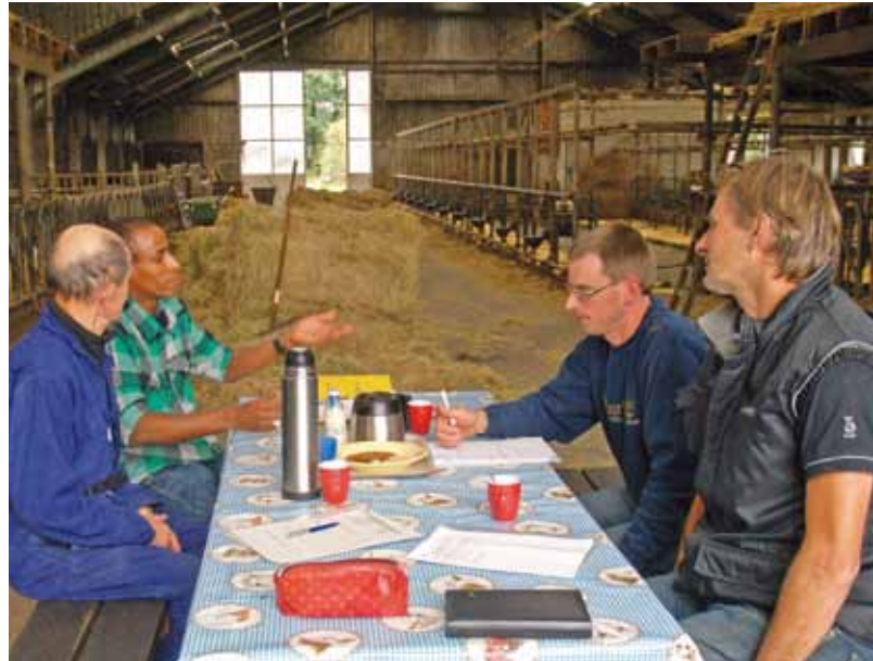
Collegiale Toetsing in de stal van de familie Kok.

Als voorbeeld noemt ze de intervisiegroep Groningen. Bij de deelnemers hing een gevoel van onmacht over de dalende prijzen. Ze voelden zich slachtoffer van de markt en mopperden daarover. Joke: "We hebben toen gekeken naar wat je hier zelf aan kunt doen. Alleen klagen heeft immers geen zin. We stelden de vraag: 'Waar ligt jouw grens? Wat doe je op het moment dat de groothandel opnieuw tien cent van de prijs afhaalt?' Het mooie was, dat uit dat gesprek werkbare oplossingen naar voren kwamen. Succesjes van eigen kracht werden uitgewisseld."