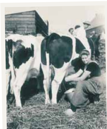
Ter Linde 1953

monsters genomen op gangbare bedrijven. Op biologische bedrijven wordt gemiddeld 70 procent minder antibioticum gebruikt. De onderzoekers wijzen erop dat het ook voor biologische varkenshouders van belang is om maatregelen te nemen om de aanwezigheid van MRSA tegen te gaan. Het rapport staat volledig op www.louisbolk.nl .